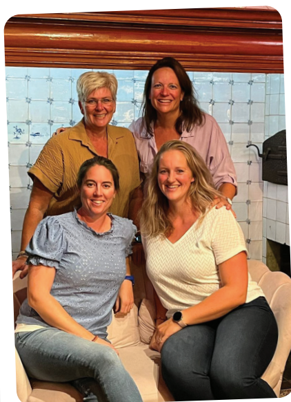
Team Stichting Thuishuis Woerden

Sinds 1 september ben ik gestart bij Stichting Thuishuis Woerden als allround medewerker. Hierbij mag ik op donderdag en vrijdag de planning doen voor Automaatje en werk ik mee aan de andere initiatieven die vallen onder deze mooie stichting.