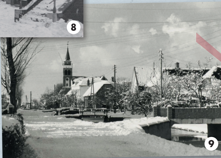
1. Mijzijde, Van Teijlingenweg Kamerik 2. Havenstraat Woerden 3. Plantsoen Woerden 4. Harmelen vanaf dorpsbrug 5. Boerderij! De Winter Kamerik 6. Boschlust Geestdorp 7. Kasteel Woerden 8. Rijnstraat Woerden 9. Hoofdweg Zegveld